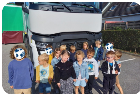
Les élèves se sont rendus à l'exposition MuMo en septembre.