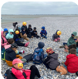
Séjour des CE1-CE2 en Baie de Somme