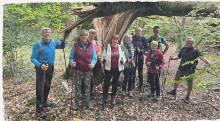
Le groupe des marcheurs de l'AMS