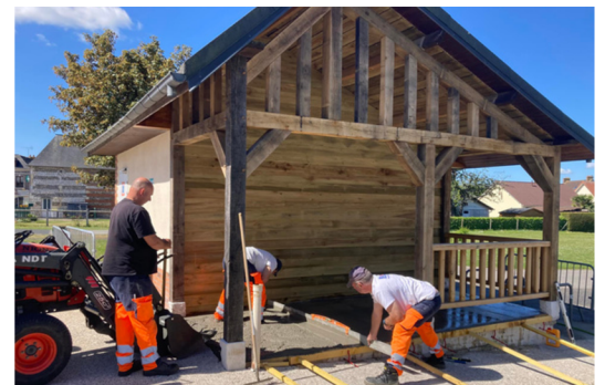
Une jolie hallette, route de St-Paër, fignolée par les employés municipaux.