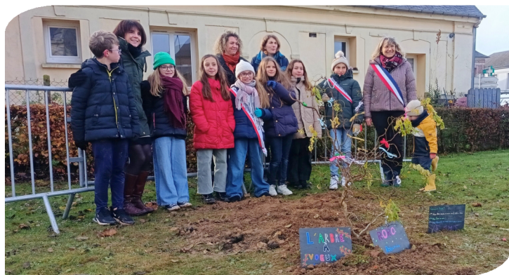
Plantation d'un arbre à vœux par le CMJ : invitation poétique à faire un vœu et accrocher un ruban au robinier. Novembre 2025.

Investir c'est préparer l'avenir de notre village, en portant des projets durables qui améliorent la qualité de vie des habitants. Grâce à une gestion prudente et équilibrée les investissements sont financés en grande partie par l'épargne de la commune, mais également par des subventions de l'État, du Département, de la Région.