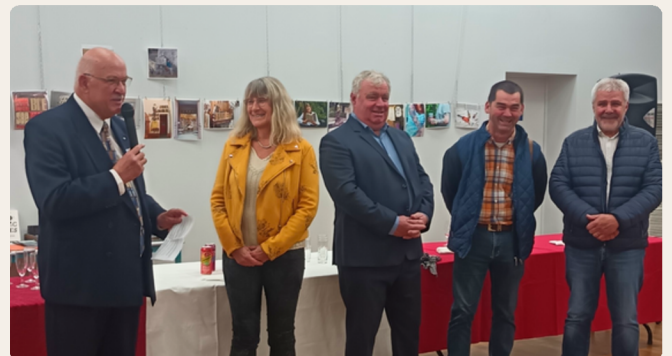
Inauguration de l'expo photo du Collectif JPG