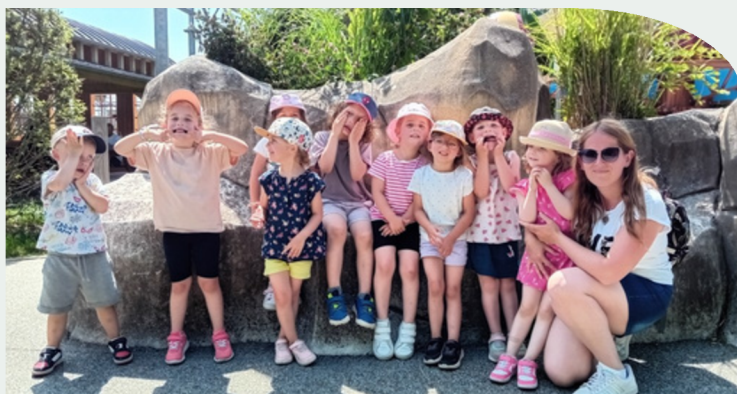
Sortie au Parc du Bocasse

Réalisation d'un court métrage durant les vacances d'avril Journée Carnaval Initiation au bowling Intervention sécurité routière Sorties patinoire et piscine Visite d'une chèvrerie Journée au Bocasse Goûter intergénérationnel Sortie au Parc Saint Paul