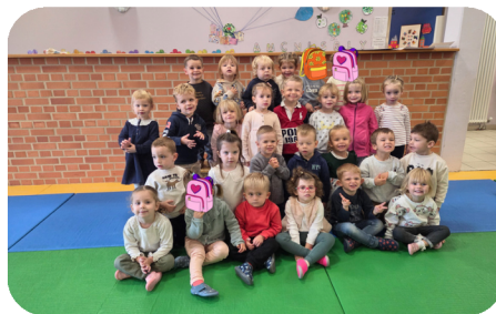
1ère rentrée pour les élèves de Petite Section à l'école maternelle.