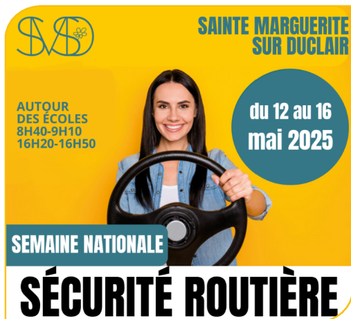
Affiche de la Semaine de la sécurité routière