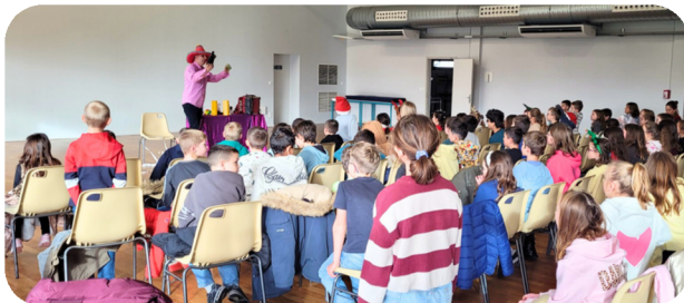
Spectacle de Noël offert par la municipalité