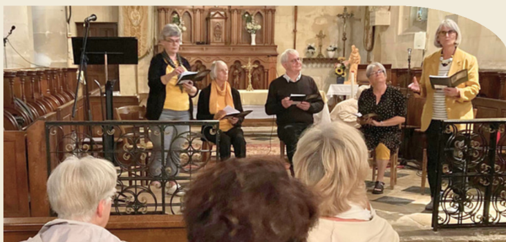
Une lecture à voix haute très émouvante par l'association Le Lire et Le Dire : "au commencement était la voix".