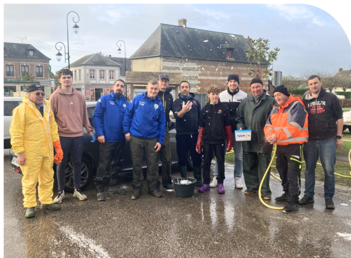
Ça mousse ! Le Club de foot FCSMD et l'Alliance Seine Judo mobilisés pour le lavage de voitures du Téléthon.

La commune remercie chaleureusement l'ensemble des associations et des bénévoles pour leur investissement sans faille, leur créativité et leur cœur. Grâce à vous, la solidarité à Sainte-Marguerite se vit et se partage toute l'année.