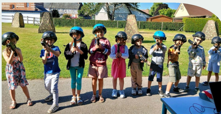
Initiation au laser game