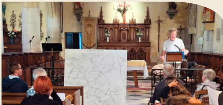
Un récit fiction pour revivre 1000 ans d'histoire par Yves Crochemore