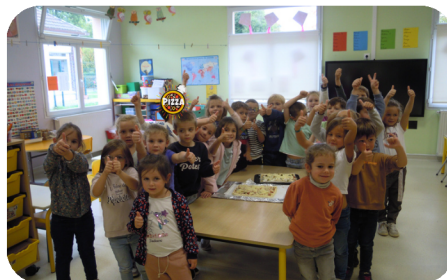
Atelier cuisine lors de la Semaine du Goût pour les plus grands de l'école.