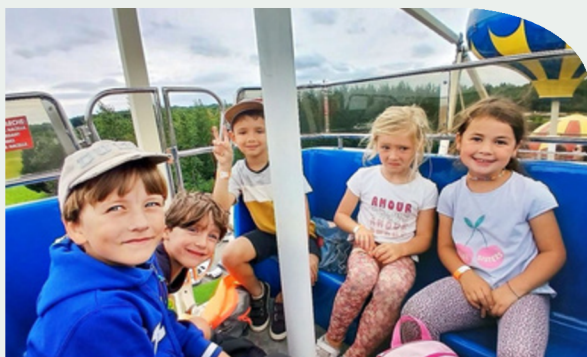
Sortie au Parc Saint Paul

Cette année, l'accueil de loisirs a mis les enfants en action ! Créativité, sport, découvertes : un programme intense, des rires et des projets qui rassemblent. Avec une équipe dynamique et attentive, chacun a vécu des moments forts et inoubliables.