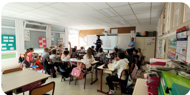
Intervention de la gendarmerie en CM1 et CM2