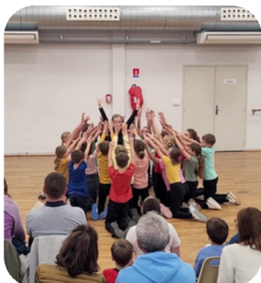
Spectacle de danse