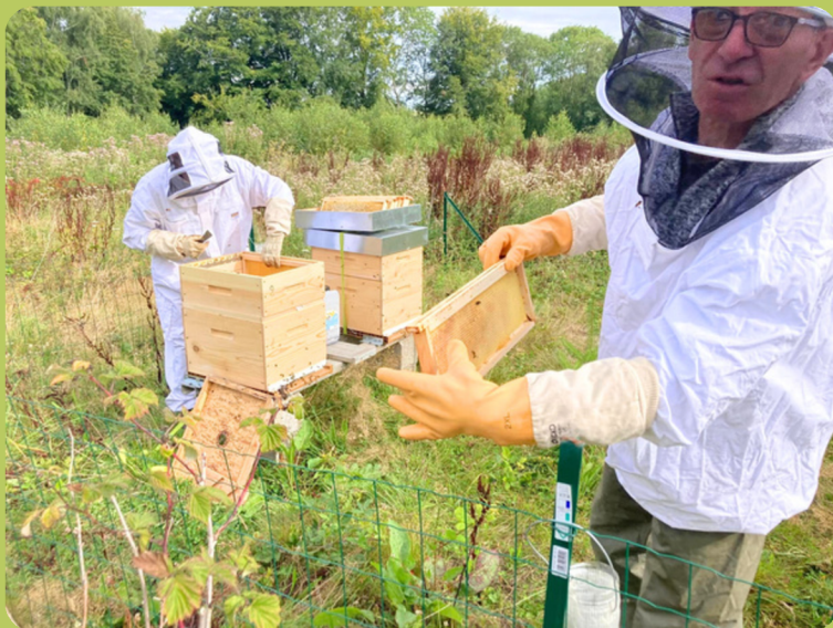
Installation de ruches communales : une belle récolte de miel distribuée dans les colis des séniors.