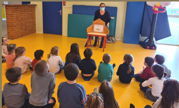
Séance de Kamishibai le mercredi 17 février au centre de loisirs. Les enfants ont pu s'exercer à l'utilisation de ce petit théâtre japonais.